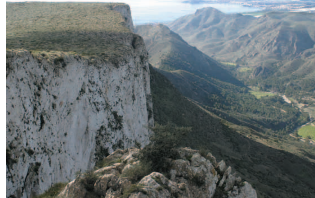
Cuestas del Cedacero Peñas Blancas

Der Abstieg beginnt bei der Schutzhütte in Richtung Osten. Die Route ist gut erkenntlich und weist ein nur leichtes Gefälle auf. Zunächst gelangt man zu den alten Erzgruben von Colón, von wo aus man in das östlich gelegene Tal über einen gut erkennbaren Pfad absteigt. Auf der Talsohle angelangt, führt ein Weg um den von Mandel- und Johannisbrotbäumen umsäumten Berg herum und leitet uns schließlich zur MU-6059. Wir folgen der Straße einige hundert Meter weit und gelangen wieder zum Ausgangspunkt bei der Gaststätte zurück. Hier kann man ausgezeichnete Wurstwaren (Schlack- und Blutwurst), Paella, Ziegenbraten zu Salat aus Tomaten und gepökeltem Fisch genießen. Die Speisen sollten natürlich mit einem der Weine der Region Cartagena begossen werden. Hier endet die Wanderung.