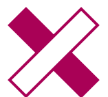
Mala dirección GR