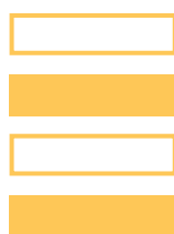
Cambio de dirección PR