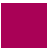
Continuidad del sendero GR