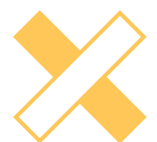
Mala dirección PR